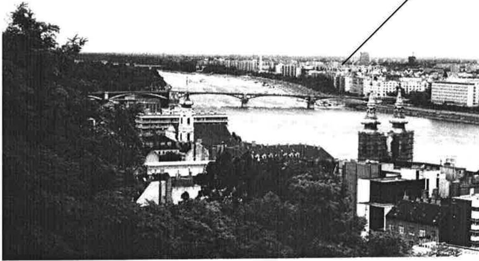
Utsiktsbilde av byene fra Gellerthøyden

Da «Ja vil elsker» ble spilt før kampen og alle de 4 - 5000 nordmenn sang med, så var det en stor og mektig opplevelse.