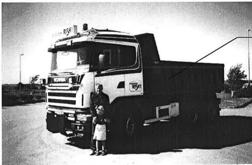
Bjarne og barnebarn Linn tar imot den nye lastebilen