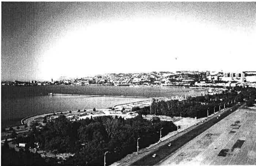
Oversiktsbilde tatt fra hotellet.