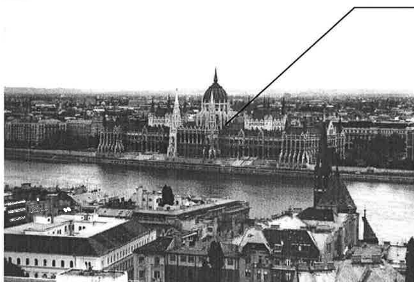
Parlamentet i Budapest fra 1600 tallet

Han hadde «hoppet» av på hjemveien for å være med på kampen, så derfor var han der før oss.