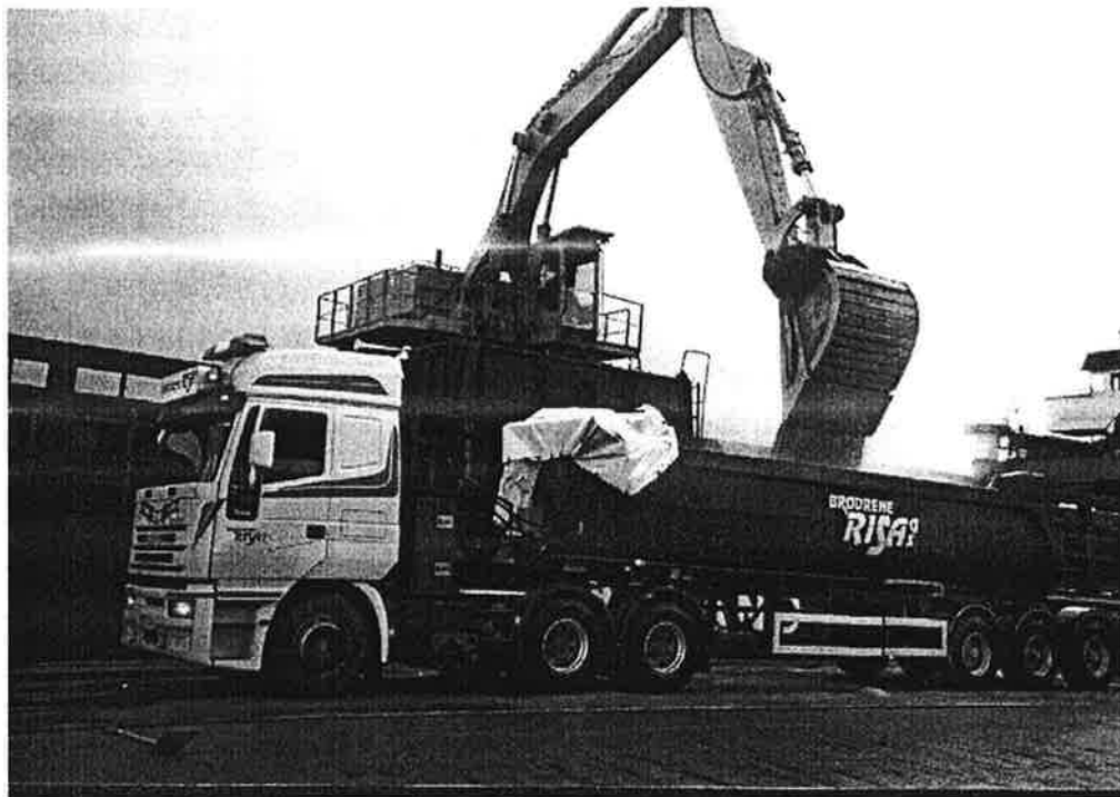
Opplasting av filterkalk på kaien i Sandnes