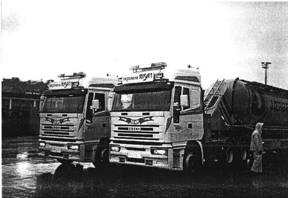
Torleif Tunheim og Aksel Friestad har fått nye biler